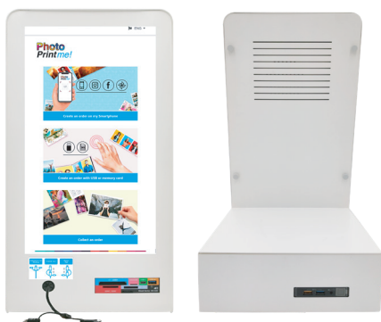
En un escritorio