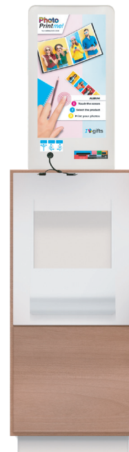
Sobre un cabinet