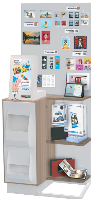
Punto de venta con estantes